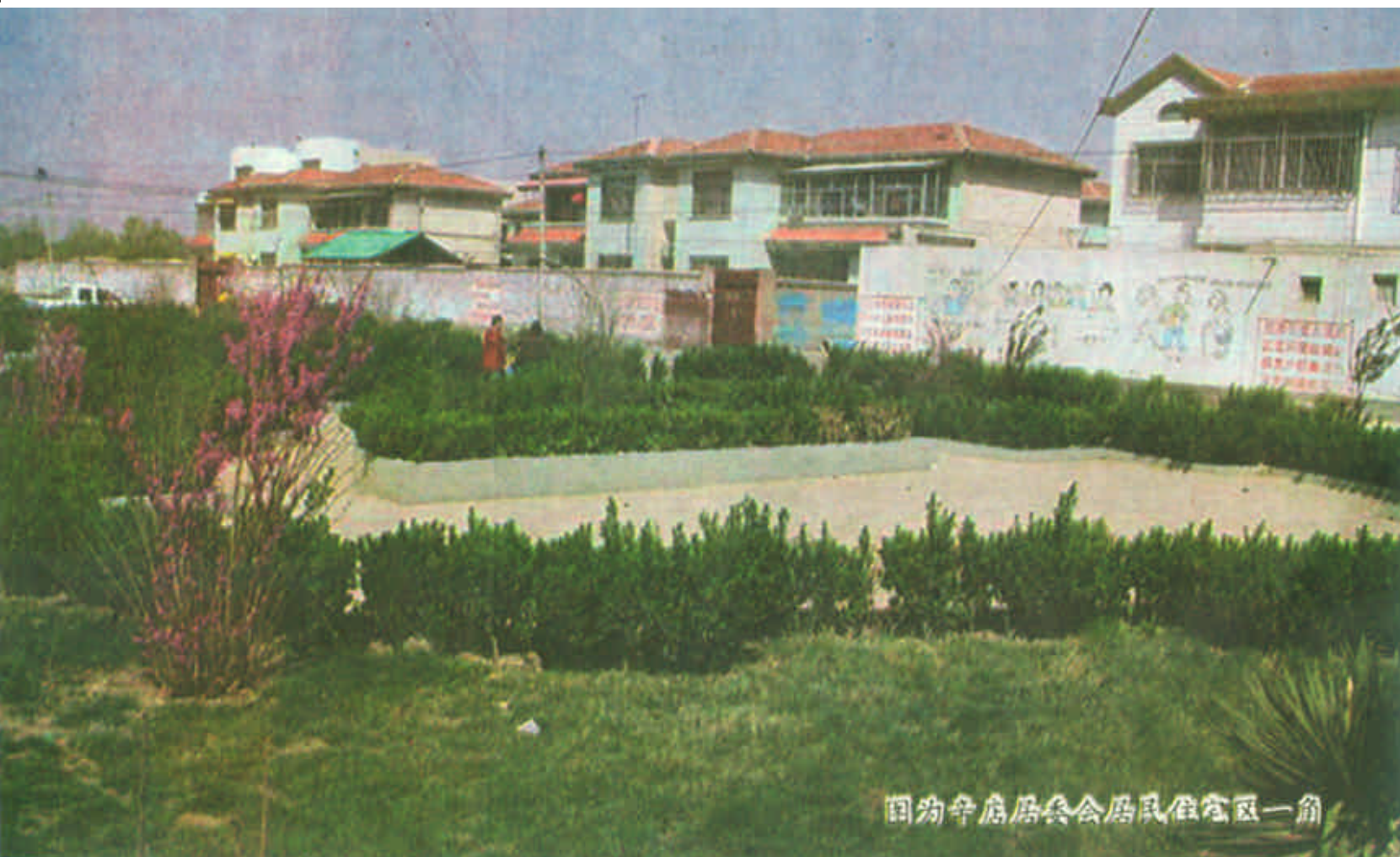
图为辛店居委会居民住宅楼一角